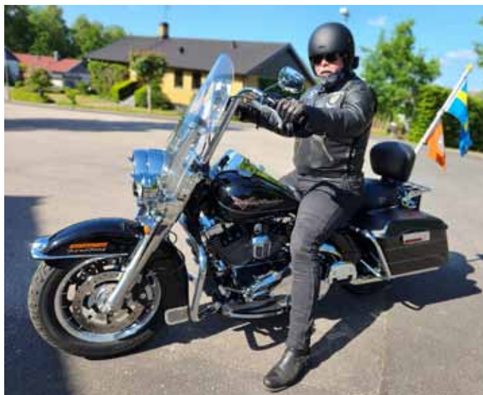
King of the road.